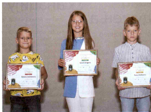
Награђени на конкурс „Моји родитељи раде у руднику“

У истом простору, а поводом десет година од адаптирања, реновирања и пуштања у рад